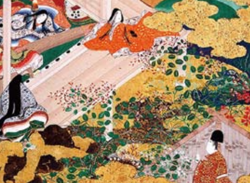
「源氏物語図色紙貼交屏風 橋姫」三重県立富宮歴史博物館蔵

お子様や一般の方が気楽に和楽器に親しみ、洋楽器との違いや古典文学との関わりなどを、わかりやすく解説するコンサート形式の公開講座です。