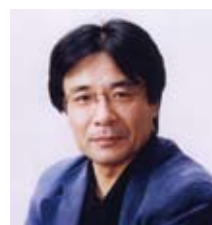
総合プロデュース 直井 研二