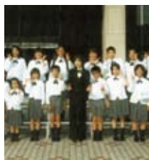
児童合唱団 ポコ・ア・ポコ