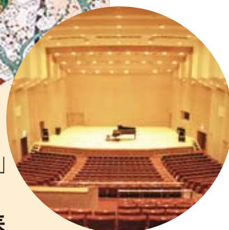
須賀友正記念ホール