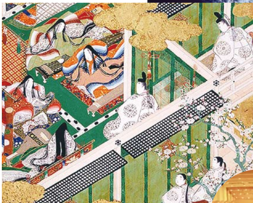
「源氏物語園色紙貼交屏風 若菜下」三重県立斎宮歴史博物館蔵